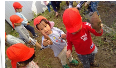
幼稚園の裏の畑でも