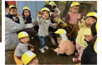
りす組とうさぎ組はここで芋ほりをしました。 結構、大きいお芋がほれました。