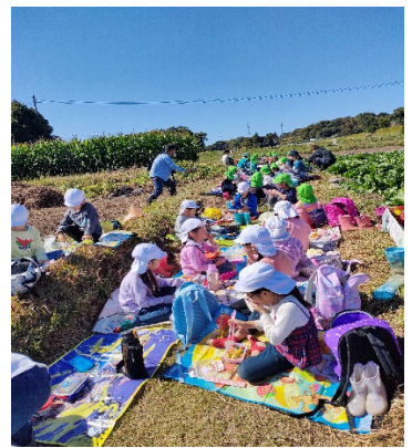
外で食べる手作りお弁当はおいしい!!