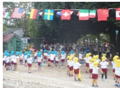
年中組「パプリカ」の表現