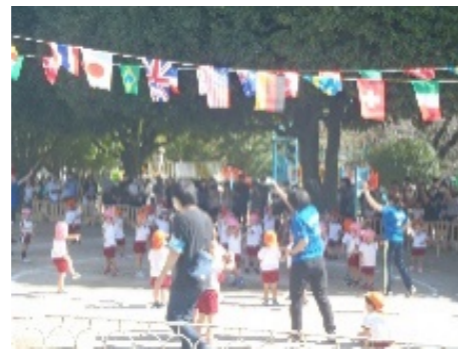
年少組のどんぐり体操