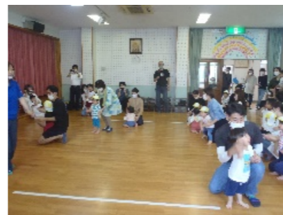
ずっと抱っこでの競技参加、保護者の方の運動会みたいでしたわ？