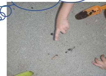
ようちゅう：ようちゅう：ようちゅう？！