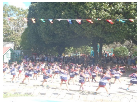
年長組のソーラン節

感染症予防を第一に、学年別・入れ替えでの運動会になりました。幼稚園としても初めての試みでした。リレーや綱引き等、できない競技があったことは残念でした。